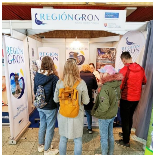
Účasť na výstave Caravan, Bike, Travel 2023 v Nitre bola prekvapením.

Úplný začiatok mesiaca sme strávili na veľtrhu karavaningu, bicyklovania a turistiky – Caravan, Bike, Travel 2023 na Agrokomplexe v Nitre. Išlo o druhý ročník tejto výstavy a Gron sa tu po minuloročnom úspechu so svojim stánkom zúčastnil opäť. Za štyri dni (štvrtok-nedeľa) našej účasti na veľtrhu navštívilo náš stánok više 550 ľudí , pričom každý sa o náš región aktívne zaujímal, keďže o ňom dosiaľ nepočuli. V stánku sme pre záujemcov realizovali aj vedomostný kvíz o našom regióne, do ktorého sa zapojilo 60 účastníkov. Číslo návštevnosti z Nitry nás príjemne prekvapilo, množstvo ľudí, ktorí sa zastavili v našom stánku sme si naplno uvedomili v momente, keď sme sa v sobotu na obed z Nitry ponáhľali doplniť zásoby materiálov do stánku.