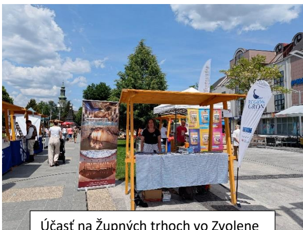
Účasť na Župných trhoch vo Zvolene

V úvode mesiaca, 2. júna 2023, sme sa s našim infostánkom zúčastnili krajských Župných trhov vo Zvolene . Túto možnosť sme dostali vďaka spolupráci s KOČR BB kraj Turizmus, ktorá trhy zastrešovala. Nielen Zvolenčanom sme odprezentovali náš región a najmä možnosti letných aktivít i novinku sezóny zážitkových vlakov – Banický expres k nám do Novej Bane.