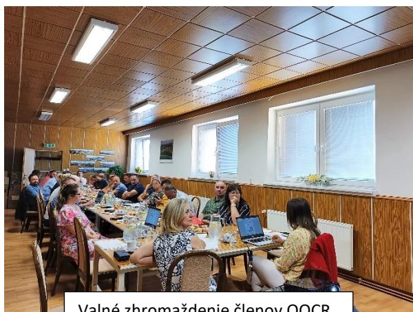
Valné zhromaždenie členov OOCR

13. júna 2023 sme sa zúčastnili metodického pracovného stretnutia so Sekciou cestovného ruchu Ministerstva dopravy SR v Žiline. Pracovné stretnutie pozostávalo z viacerých tematických blokov venovaných napr. významu zberu dát v cestovnom ruchu či produktom pre turistov, ktoré v regiónoch fungujú. Hlavnou témou a súčasťou stretnutia bol však podpis zmluvy k dotácii k nášmu projektu na rok 2023. Zmluvu sme úspešne podpísali a na konci mesiaca nám dotačné prostriedky dorazili na bankový účet. Naplno teda môžeme rozbehnúť všetky aktivity, ktoré sme si tento rok zaumienili.