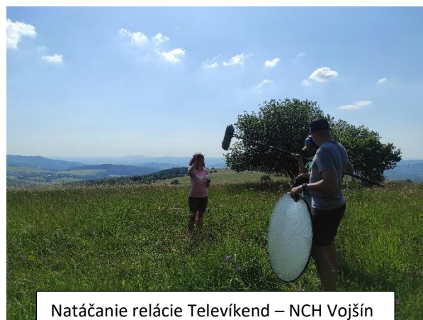
Natáčanie relácie Televíkend – NCH Vojšín

16. júna 2023 sme absolvovali celodenné natáčanie reportáže do obľúbenej víkendovej turistickej relácie Televíkend . reportáž bola výsledkom infocesty, ktorú sme v regióne realizovali v novembri minulého roka a týkala sa Náučného chodníka Vojšín. V televízii by mala byť odvysielaná približne v polovici júla.