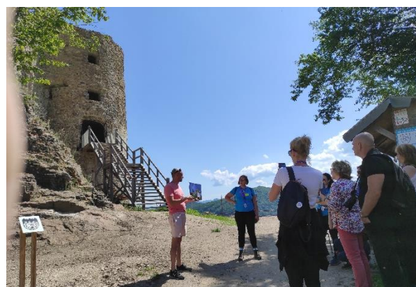
Infocesta maďarských novinárov na hrade Revište

bicykli prejsť až na hrad Revište a k Hronu, je tu takisto možné spojiť cyklovýlet so splavovaním.