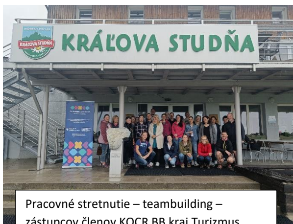
Pracovné stretnutie – teambuilding – zástupcov členov KOČR BB kraj Turizmus

stretnutia sa konajú v ročnom intervale a na budúci rok privítame kolegov u nás v Grone.