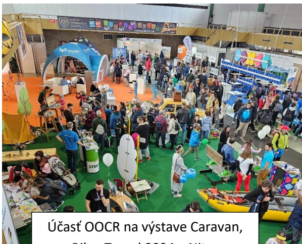
Účasť OOCR na výstave Caravan, Bike, Travel 2024 v Nitre

návštevníkom ponúkal ochutnávku zdravých a chutných produktov z Arónie z Pajera .