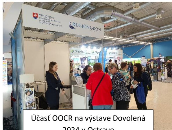
Účasť OOCR na výstave Dovoľená 2024 v Ostrave

Tohtoročný marec sme preto odštartovali ani nie v regióne, ale rovno v zahraničí. V termíne 1.-2. marca 2024 sa v Ostrave (ČR) konal už 26. ročník veľtrhu cestovného ruchu – Dovoľená 2024 . Región GRON teda išiel na „dovoľenou“ ani zďaleka však nešlo o oddych – práve naopak. Počas dvoch dní sme v našom stánku prezentovali krásy a atraktivity nášho regiónu – stredného Pohronia. Spolu s nami sa výstavy zúčastnili aj zástupcovia z Krajskej hviezdárne a planetária M. Hella v Žiari nad Hronom, ktorí so sebou nezabudli vziať ani Terralón – nafukovací model planéty Zem. V priebehu dvoch dní tak Terralón pútal pohľady návštevníkov veľtrhu a objavil sa na toľkých fotkách, že by mu mohol závidieť akýkoľvek influencer.