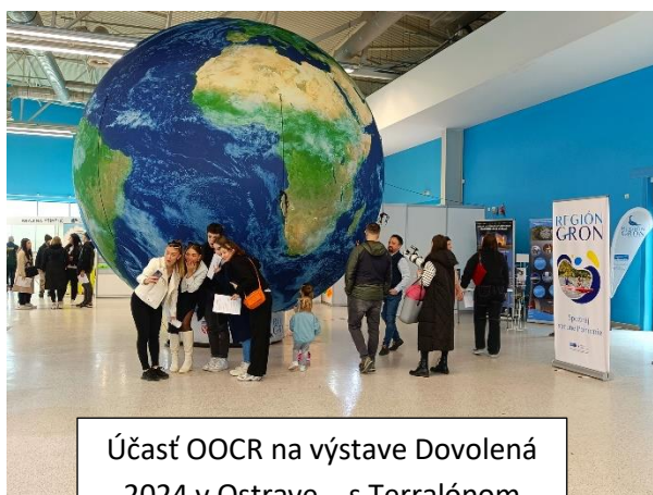
Účasť OOCR na výstave Dovoľená 2024 v Ostrave – s Terralónom

Hoci je marec posledným zimným mesiacom, u nás v regióne je to už čas, kedy jednak prebiehajú prípravy na nadchádzajúcu turistickú sezónu (leto), a jednak je aj obdobím, kedy sa nám začínajú prvé víkendové aktivity pre verejnosť. Prvá štvrtina roka je tiež zvyčajným obdobím konania veľtržných podujatí venovaných cestovnému ruchu, ktorých sa zúčastňujeme.