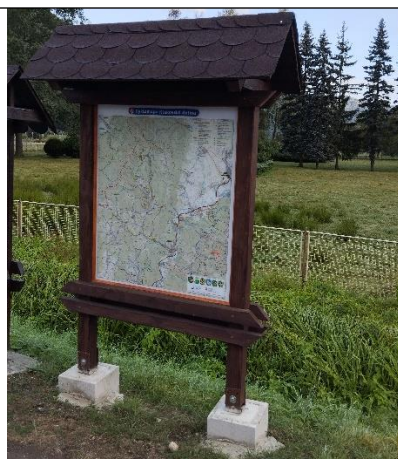
Nová infotabuľa na Brode v Horných Hámroch

Sociálny podnik Horné Hámre s.r.o., r.s.p. nám počas septembra kompletizoval a osádzal dve nové informačné tabule s cyklomapami Klákovskej doliny .