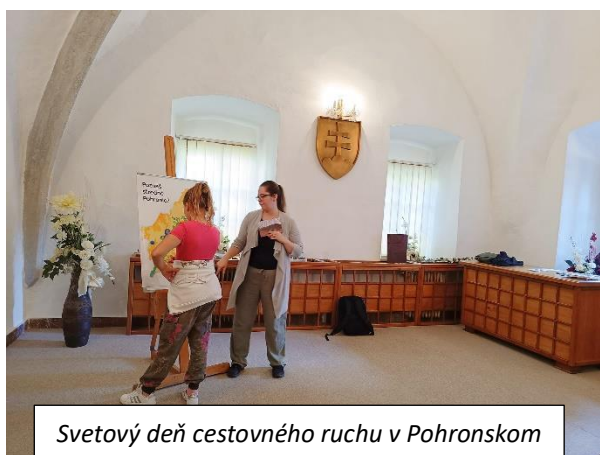
Svetový deň cestovného ruchu v Pohronskom múzeu

úlohu turizmu nielen z hľadiska prínosu do ekonomiky, ale najmä z pohľadu významu pre spoločnosť. V Regióne GRON posledné roky v tomto kontexte úzko spolupracujeme s Pohronským múzeom v Novej Bani. Aj tento rok sme svojou troškou prispeli do ich programu, a to zastrešením regionálneho vedomostného kvízu pre školské skupiny v dopoludňajších hodinách. Kvíz tentokrát doplnila nová atraktívna slepá mapa regiónu, s ktorou sa však deti hrdo popasovali a za správne odpovede si vyslúžili nejakú tú odmenu.