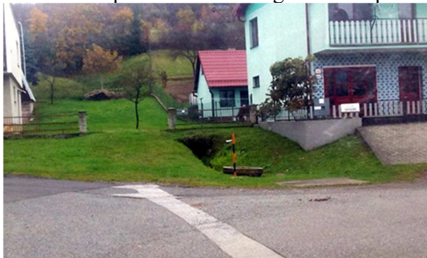
Obr.1: Vstup do bane Neufang na ulici Spodnej