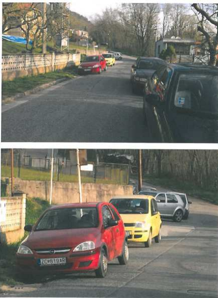
Obr.1,2: Ul. Švantnerova- prac. deň