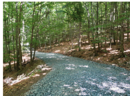
Zrekonštruovaná lesná cesta

V roku 2022 naša spoločnosť za prvých 10 mesiacov dodala obyvateľom mesta v histórii fungovania rekordné množstvo palivového dreva v objeme 6533 plnometrov palivového dreva rôznych sortimentov. Metrovicu, palivo v dĺžkach a štiepané palivové drevo v paletách, prípadne voľne uložené. Chceme tým povedať a zdôrazniť, že aj takýmto spôsobom sme pomohli obyvateľom mesta a blízkeho okolia počas energetickej krízy a sme aj naďalej schopní podať pomocnú ruku ľuďom, ktorí sú na to odkázaní.