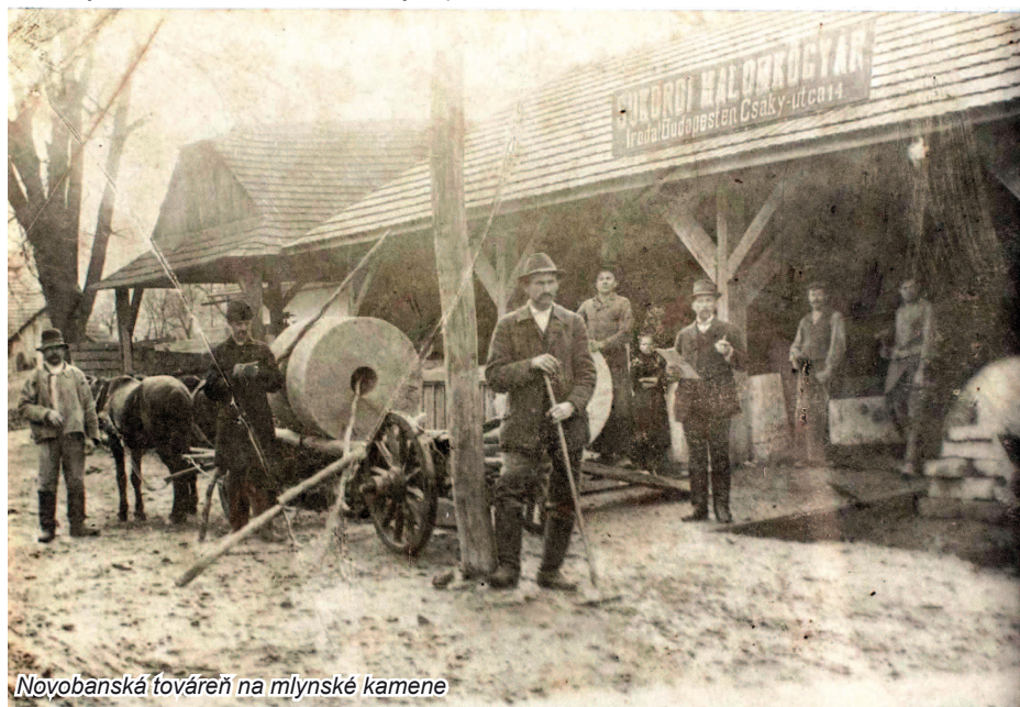
Novobanská továreň na mlynské kamene

* 8. júna bola v Novej Bani birmovka. Birmovaní boli Novobančania spoločne s obyvateľmi Breznice, Rudna a Brehov. Spoločne ich bolo vraj vyše 2000!