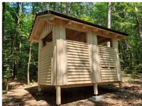
Mestská včelnica Háj