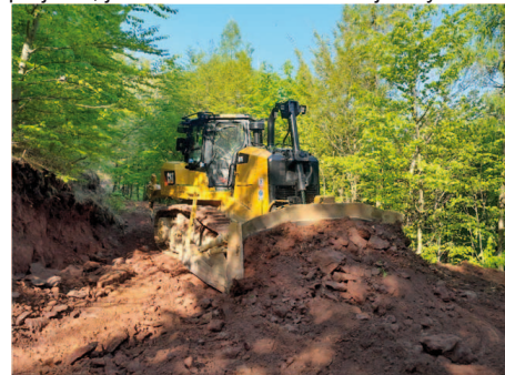
Rekonštrukcia lesnej cesty na úseku Bukovina

Pri lesných cestách, v prípade úspešnosti projektu, je to až 80 % z realizačnej ceny.