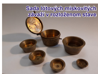
Sada lótvých miskovitých závaží v rozloženom stave