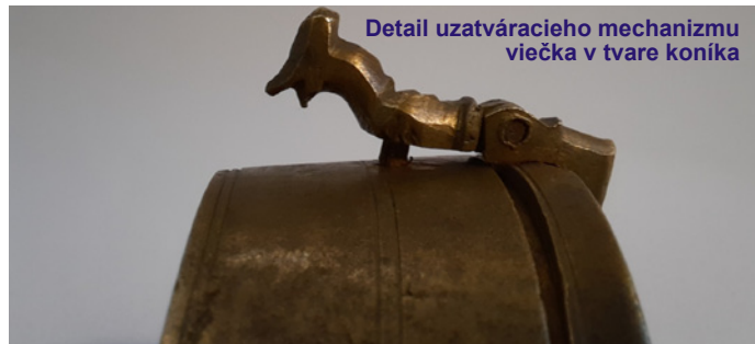
Detail uzatváracieho mechanizmu viečka v tvare koníka