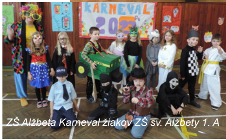
ZŠ Alžbeta Karneval žiakov ZŠ sv. Alžbety 1. A