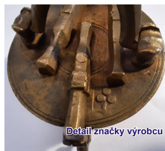
Detail značky výrobcu

Bližšie určenie majstra a proveniencie je možné na základe puncov a značiek, prípadne vročenia priamo na exemplári. Sada z našich zbierok obsahuje, bohužiaľ, iba jedinú značku v tvare kvetu s tromi lupeňmi. Podľa toho by bolo možné určiť výrobu pravdepodobne v nemeckom Norimbergu. Datovanie podľa majstorskej značky v komparácii s nálezovou situáciou je možné určiť na polovicu 16. až koniec 17. storočia. (OBR. 5)