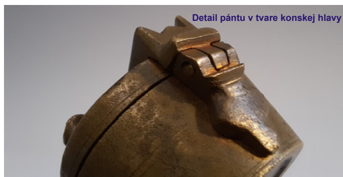
Detail pántu v tvare konskej hlavy