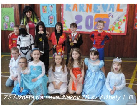
ZŠ Alžbeta Karneval žiakov ZŠ sv. Alžbety 1. B

históriu nášho mesta. Zamestnanci školy absolvovali duchovné cvičenia v kláštore Premenenia Pána v Sampore, kde načerpali v atmosfére ticha mnoho síl. Pookriali nielen na tele, ale hlavne na duši.