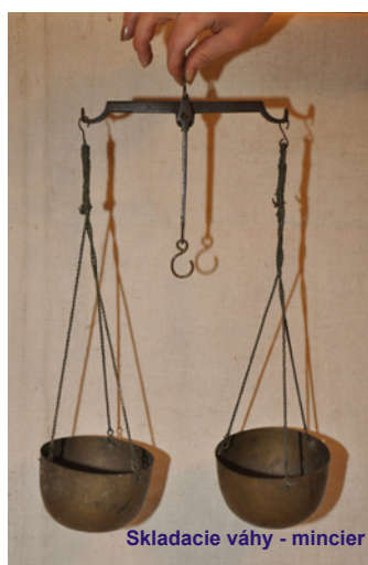
Skladacie váhy - mincier

Lót je stará jednotka váhy a rýdzosti používaná v mincovníctve, klenotníctve na označenie akosti striebra. Podľa nej sa nazýva sústava lótvá. Skúška rýdzosti sa nazýva lótvá próba. Všeobecne platili lóty v Európe do 19. storočia, kedy ich nahradila sústava SI.