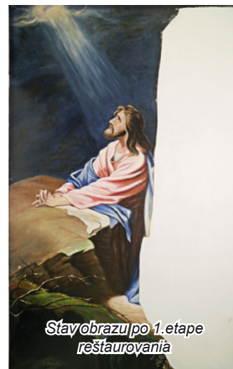
Stav obrazu po 1. etape reštaurovania