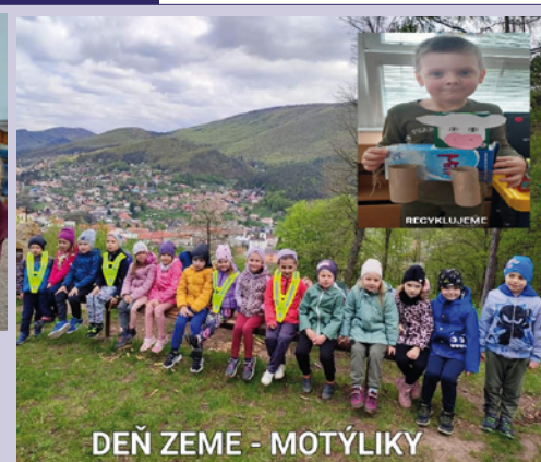
DEŇ ZEME - MOTÝLIKY