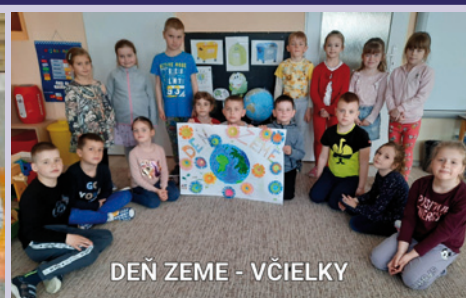
DEŇ ZEME - VČIELKY