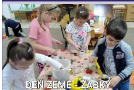
DEŇ ZEME - ŽABKY