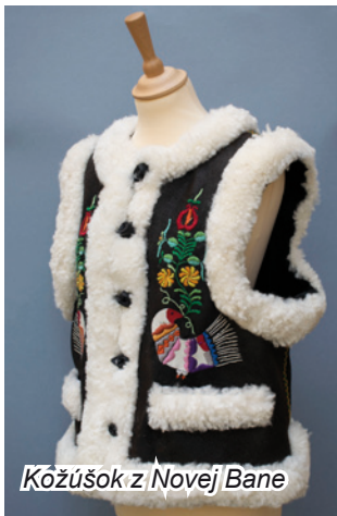
Kožúšok z Novej Bane