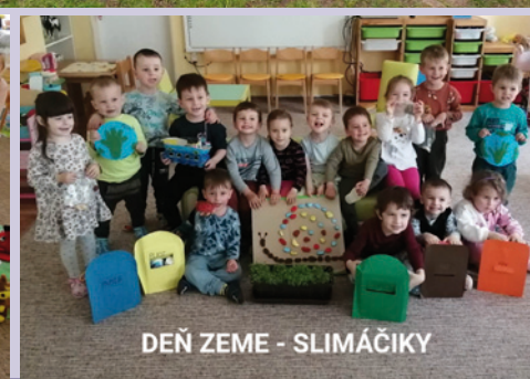
DEŇ ZEME - SLIMÁČIKY