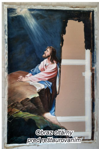
Obraz oltárny pred reštaurovaním

kultúrnou pamiatku umiestnenú v národnej kultúrnej pamiatke – kostole. Oltárny obraz bol vážne poškodený počas požiaru. Bola poškodená pravá strana oltárneho obrazu približne na 45 % plochy. Pôvodný vlastník, Cirkevný zbor ECAV na Slovensku Hodruša - Hámre, Dcérocirkev Kopanice, sa rozhodol obraz premiestniť do Pohronského múzea, keďže spadá do oblasti zberu múzea. Premiestnenie schválil aj Krajský pamiatkový úrad Banská Bystrica. Obraz bol do zbierok múzea prijatý v roku 2020 formou prevodu vlastníctva. Do oltára v Kopaniciach bola v roku 2020 umiestnená technologická kópia, ktorú zhotovil akad. mal. Ľubomír Čáp.