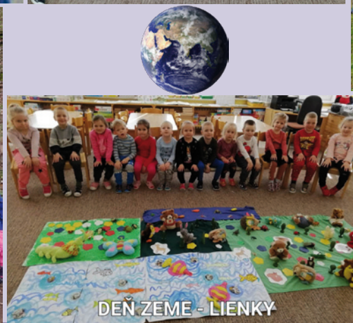
DEŇ ZEME - LIENKY