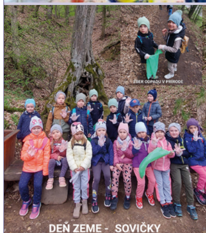
DEŇ ZEME - SOVIČKY