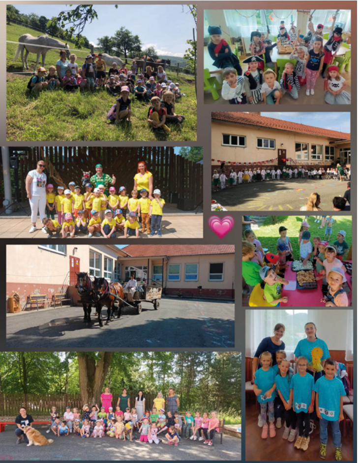
Ďakujeme za šťastné tváre vašich - našich detí.

Na záver patrí veľké poďakovanie všetkým, ktorí akoukoľvek pomocou prispeli, aby sa tieto vydaté akcie mohli zrealizovať.