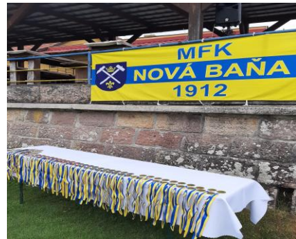
110. rokov Mestského futbalového klubu Nová Baňa