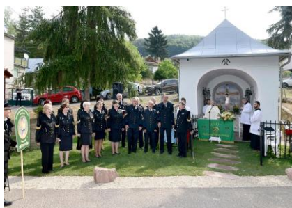
Oslavy pri príležitosti 200 výročia Banickej kaplnky