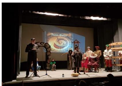
Oslavy 300.výročia postavenia Potterovho ohňového stroja