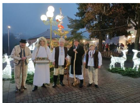
Vianočná Nová Baňa