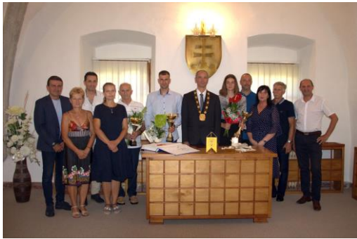
Vyhlasenie najúspešnejších športovcov, trénerov a zaslúžilých funkcionárov mesta Nová Baňa za rok 2021