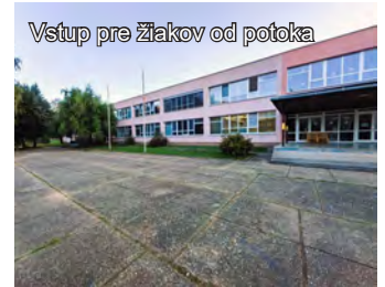
Vstup pre žiakov od potoka

Mesto predložilo v októbri v 1. kole žiadosť o nenávratný finančný príspevok z Operačného programu Slovensko zameraný na rekonštrukciu a modernizáciu základných škôl v sume necelých 562 000 eur, vrátane 8% spolufinancovania. Realizáciu plánuje dosiahnuť 5 aktivitami: podporou rovného prístupu k neselegovanému a inkluzívnemu vzdelávaniu formou vytvorenia učebne špeciálno-výchovno-vzdelávacích potrieb, obnovou učební a nákup materiálo-technického vybavenia pre učebňu geografie, hudobnej náuky, kompletnou debarierizáciou objektov školy vrátane areálu a telocvične, ako aj rekonštrukciou objektu školy a komplexnou obnovou interiéru telocvične i vybudovaním nového doskočiska do výšky.