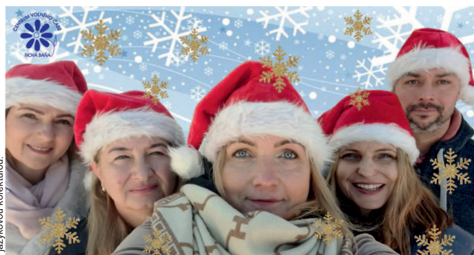
Príspevok neprešiel jazykovou korektúrou.

Radostné a pokojné prežitie vianočných sviatkov, šťastný nový rok 2024, Vám praje kolektív 65 ročného CVČ Nová Baňa