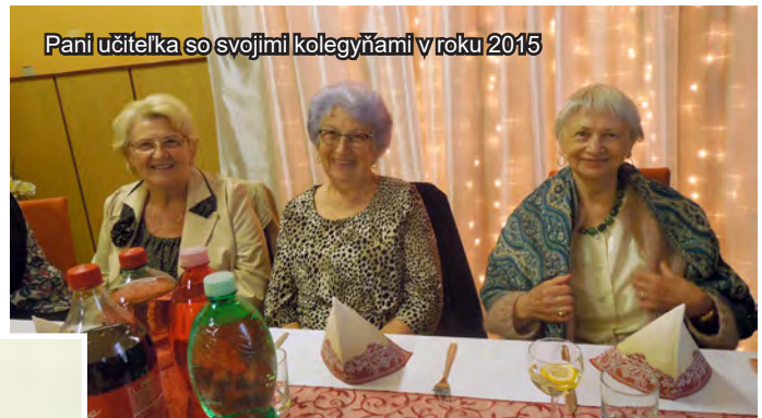
Pani učiteľka so svojimi kolegyniami v roku 2015

Bola aj veľkou oporou svojmu manželovi, udržiavala jeho pracovňu, chránila jeho vzácne historické materiály. Spomínam si, ako som ich spolu často stretávala na potulkách po prírode. Pani učiteľka tieto prechádzky mala už z rodiny, chodievala po Novej Bani a jej okolí so svojím otcom.